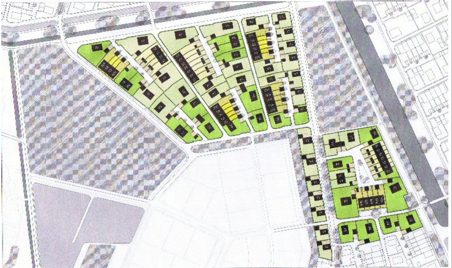
Plattegrond uitbreiding Loverbosch.

Al geruime tijd wordt gewerkt aan de uitbreidingsplannen aan de oostzijde van Asten bij de Koestraat. Men is voornemens hier tot 2012 400 woningen te realiseren en op langere termijn mogelijk tot 1200 woningen. Na de twee vorige bijeenkomsten die de gemeente heeft gehouden over dit uitbreidingsplan zal er binnen kort mede op verzoek van de wijkraad weer een informatie bijeenkomst gehouden worden door de gemeente om de omwonenden op de hoogte te brengen van de laatste gang van zaken.