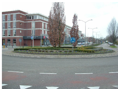
Dit prachtig groen moet gaan wijken voor een kunstwerk

In het collegeprogramma, dat tot 2010 loopt, is afgesproken dat er in deze collegeperiode meer kunst in de openbare ruimte, dus op straat, moet komen. Hiervoor heeft de gemeenteraad een bedrag van € 100.000 gereserveerd. Een van de plaatsen waar een kunstwerk moet gaan komen is op de rotonde bij medisch centrum Campanula.