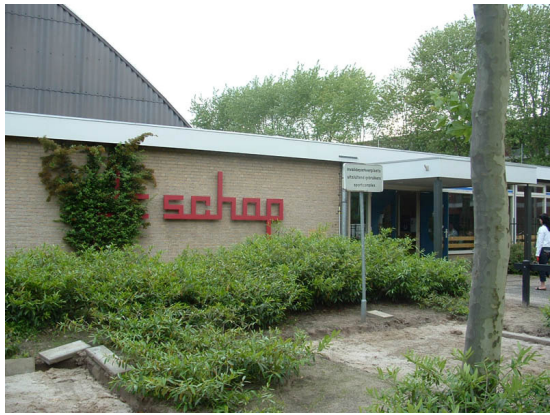
Klein onderhoud voor sporthal De Schop

De werkzaamheden bestaan uit het vervangen van twee