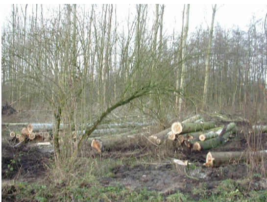
De beide bossen zijn uitgedund

In Asten-Oost is de afgelopen maanden veel te doen geweest omtrent de bossen. Vooral het bos van de toekomst (tussen Ruimte voor Ruimte en Dalkruid) en het bos Loverbosch (tussen Elfenbank en Vlinderveld) zijn onderwerp geweest van gesprek geweest en uiteindelijk is er in beide bossen gerooid.