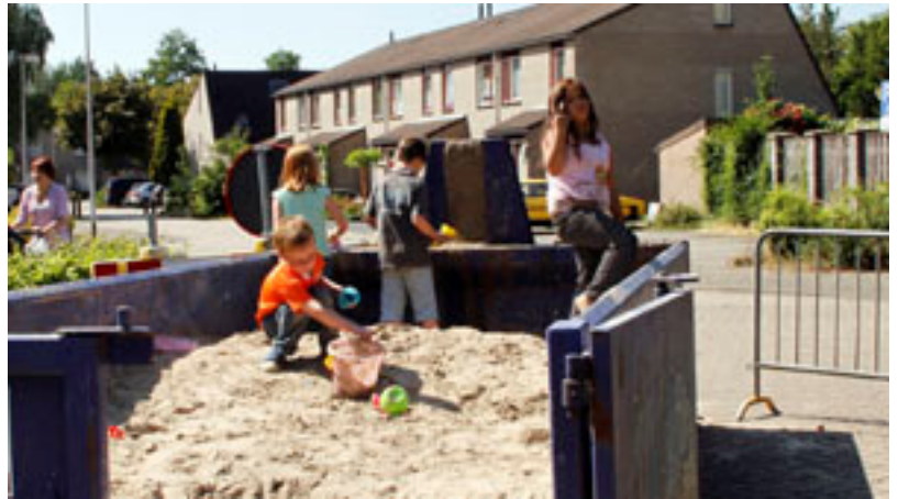
De drukbezochte straatspeeldag op de Elfenbank

Er was een reuze zandbak en verder konden er verschillende spelletjes gedaan worden waaronder skippieballen, tekenen op straat en spelen met water wat leuk was vanwege het warme weer.