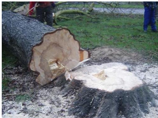
Een van de elf gekapte eiken op de Eikelaar

Op 30 november zijn, in overleg tussen gemeente en bewoners, de elf eiken gekapt. De bomen zijn met groot materiaal, waaronder een mobiele kraan van boven naar beneden uitgedund en uiteindelijk omgezaagd.