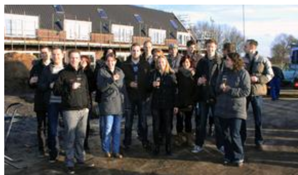
De toekomstige bewoners toosten op hoogste punt .

Het begon allemaal in 2008 toen CDA Asten twee informatie-bijeenkomsten over CPO organiseerde. De bijeenkomsten werden goed bezocht en er werd een werkgroep opgericht die ging bekijken wat de mogelijkheden waren in Asten.