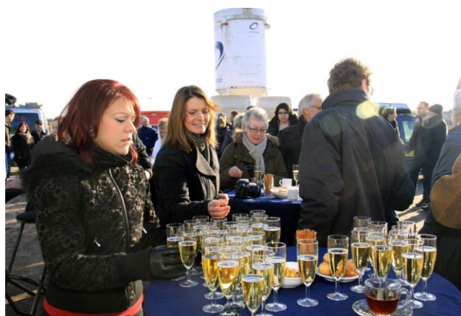
De drankjes staan gereed bij bereiken van het hoogste punt

Interesse om zelf ook deel te nemen aan een CPO project?